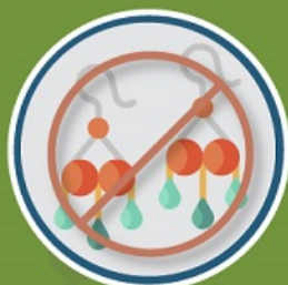
Aretes y Piercings